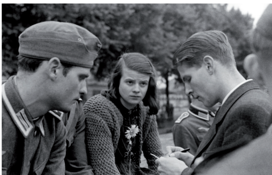
Hans und Sophie Scholl, Christoph Probst vor der Abreise nach Russland am Ostbahnhof

Dazu braucht es Engagement – gegen das Totschweigen. Kaum zu glauben: An Georg Elser (Attentat gegen Hitler) erinnert in seinem Heimatort Königsbrunn erst seit 2010 eine Statue. Die Bürgerinitiative in Christophs Geburtsstadt Murnau erreichte es 2011 , dass im Gemeindezentrum an ihn erinnert wird.