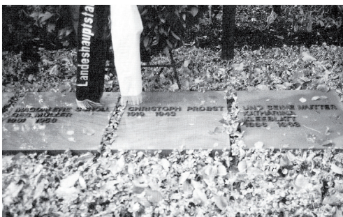
Gräber von Christoph Probst, Hans und Sophie Scholl auf dem Friedhof „Perlacher Forst“ in München

Der Volksgerichtshof verurteilte am 22. Februar 1943 im Schwurgerichtssaale des Justizpalastes in München den 24 Jahre alten Hans Scholl, die 21 Jahre alte Sophia Scholl, beide aus München, und den 23 Jahre alten Christoph Probst aus Aldrans bei Innsbruck wegen Vorbereitung zum Hochverrat und wegen Feindbegünstigung zum Tode und zum Verlust der bürgerlichen Ehrenrechte. Das Urteil wurde am gleichen Tag vollzogen.