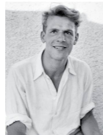
Mit 23 Jahren von den Nazis ermordet